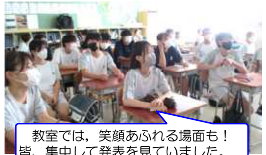
教室では、笑顔あふれる場面も！皆、集中して発表を見ていました。