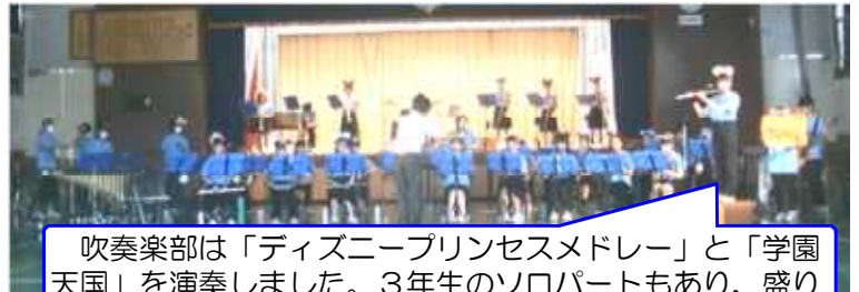
吹奏楽部は「ディズニープリンセスメドレー」と「学園天国」を演奏しました。3年生のソロパートもあり、盛り上がりました！