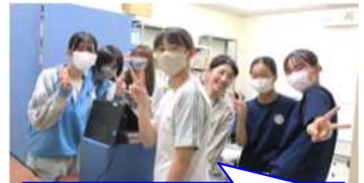
実行委員や生徒会執行部は、放送室からの配信を、頑張っていました。

9月1日(金)、南中祭(第1部 動画発表の部)を行いました。今年のスローガンは『あつまれ 南中の森～最高の南中祭にしよう～』。南中生皆で集まって文化祭を行えることを楽しみにしていましたが、今年は、猛暑による熱中症対策のため、体育館での発表・見学が叶わず、すべて動画配信での発表となりました。体育館での生のパフォーマンスを楽しみにしていた人も多かったと思うのですが、“与えられた環境の中で、できることを楽しむ”というのは、過去2年間、いろいろな場面で学んできたこと。教室での見学の時間には、真剣に映像を見ている皆の姿が印象的でした。