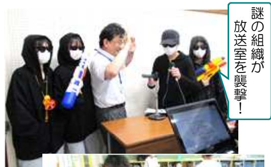
謎の組織が放送室を襲撃！

今年は、新たな試みで、実行委員会 & 生徒会企画として、全校レクリエーションを行いました。「突然、襲撃され、連れ去られてしまった校長先生を助けるべく、南中生皆で協力し、難問解決を目指す」という謎解き企画。3年生の各クラスが、1, 2年生のクラスとペアになり、お互いに、手元にあるヒントをもとに情報を伝え合い、解決を目指して頑張りました。どのクラスも、難問に頭を悩ませながらも、楽しそうに活動していました。